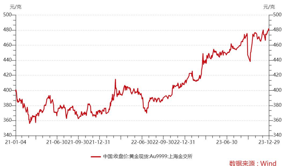
图 2021 年初至 2023 年末黄金价格趋势图

年初开盘价 1,835.05 美元/盎司上涨 12.39%，年度均价 1,940.54 美元/盎司，较上一年 1,800.09 美元/盎司上涨 7.80%。上海黄金交易所 Au9999 黄金 12 月底收盘价 479.59 元/克，较 2023 年初开盘价上涨 16.69%，全年加权平均价格为 449.05 元/克，较上一年上涨 14.97%。